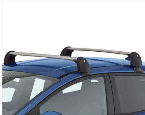
BAGAŻNIK DACHOWY (2 527 164)

1 439 PLN | Tylko dla wersji bez dachu panoramicznego