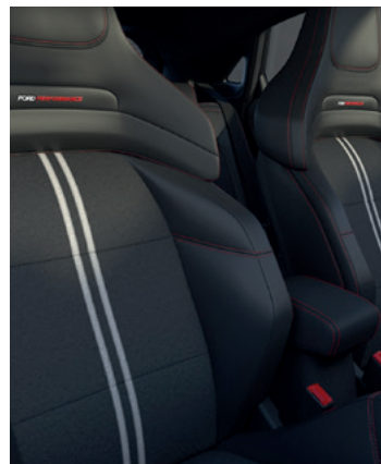
TAPICERKA CZĘŚCIOWO SKÓRZANA Z FOTELAMI FORD PERFORMANCE Standard dla wersji ST X