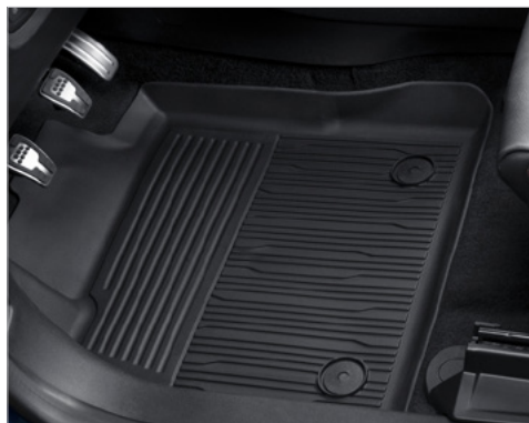
DYWANIKI PODŁOGOWE - PRZÓD, 2 SZT. (2 439 078)

Z czujnikami monitorowania ciśnienia w oponach. Opony Semperit Speed-Grip 5, 205/65 R16 95 H 5 904 PLN