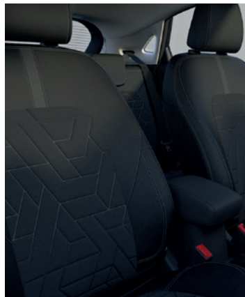
TAPICERKA MATERIAŁOWA Z MOŻLIWOŚCIĄ ZDJĘCIA I PONOWNEGO ZAŁOŻENIA 1 300,- wersji Titanium