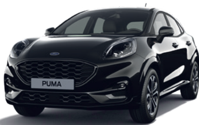
AGATE BLACK - LAKIER METALIZOWANY 2 500,- | 1 300,- dla wersji ST X