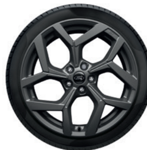
19" OBRĘCZE KÓŁ ZE STOPÓW LEKKICH OGUMIENIE 225/40

Pakiet Exterior Design dla wersji ST-Line X