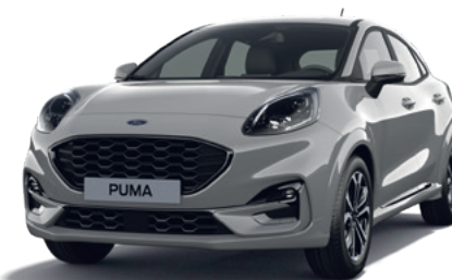
GREY MATTER - LAKIER SPECJALNY 5 000,-