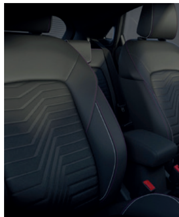
TAPICERKA CZĘŚCIOWO SKÓRZANA (SKÓRA EKOLOGICZNA) Z AKCENTAMI W KOLARACH: BEAUTIFUL BERRY RED ORAZ PEARL WHITE Standard dla wersji Vivid Ruby Edition