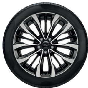
18" OBRĘCZE KÓŁ ZE STOPÓW LEKKICH OGUMIENIE 215/50