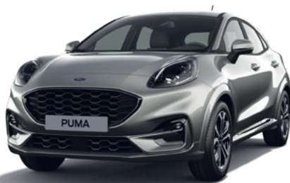
SOLAR SILVER - LAKIER METALIZOWANY 2 500,- | niedostępny dla wersji ST X