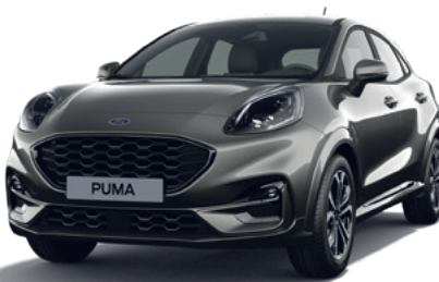
MAGNETIC GREY - LAKIER METALIZOWANY 3 150,- | 1 950,- dla wersji ST X