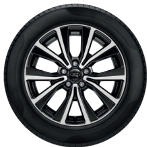
17" OBRĘCZE KÓŁ ZE STOPÓW LEKKICH OGUMIENIE 215/55