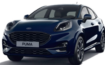
BLAZER BLUE - LAKIER ZWYKŁY bez dopłaty | niedostępny dla wersji ST X