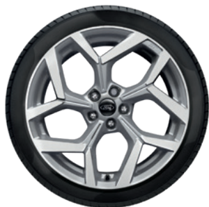
18" OBRĘCZE KÓŁ ZE STOPÓW LEKKICH OGUMIENIE 215/50

Standard dla wersji ST-Line X oraz Vivid Ruby Edition