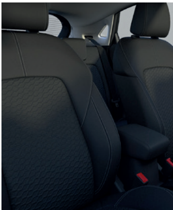
TAPICERKA MATERIAŁOWA Standard dla wersji Titanium