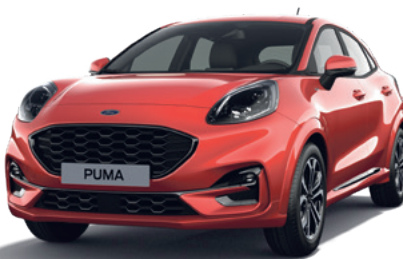
FANTASTIC RED - LAKIER METALIZOWANY SPECJALNY 3 800,- | 2 600,- dla wersji ST X