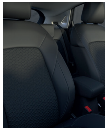
TAPICERKA CZĘŚCIOWO SKÓRZANA (SKÓRA EKOLOGICZNA) 1 300,- wersji Titanium