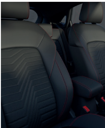
TAPICERKA CZĘŚCIOWO SKÓRZANA (SKÓRA EKOLOGICZNA) Z CZERWONYMI AKCENTAMI Standard dla wersji ST-Line X