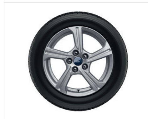
16" KOMPLETNE KOŁA ZIMOWE (2 633 233)

1 353,- | Tylko dla wersji z bagażnikiem dachowym