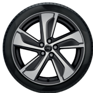
19" OBRĘCZE KÓŁ ZE STOPÓW LEKKICH OGUMIENIE 225/40

Pakiet White Design dla wersji Vivid Ruby Edition