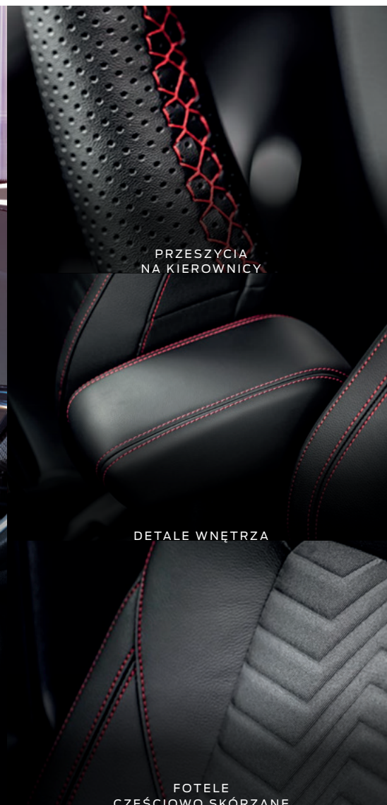
PRZESZYCIA NA KIEROWNICY