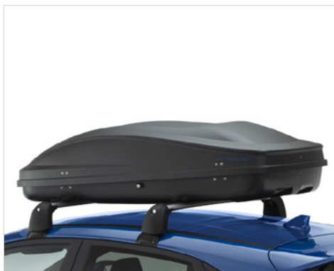
BOX DACHOWY ELEGANCE EUROPE 330 (2 191 625)

1 439 PLN | Tylko dla wersji bez dachu panoramicznego