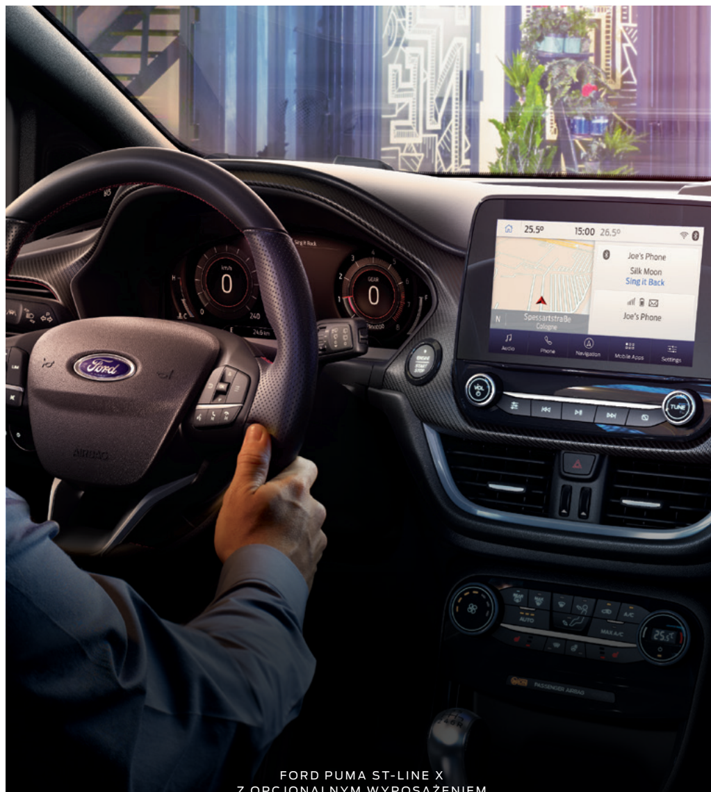
FORD PUMA ST-LINE X Z OPCJONALNYM WYPOSAŻENIEM