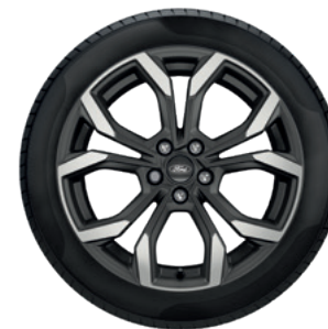
18" OBRĘCZE KÓŁ ZE STOPÓW LEKKICH OGUMIENIE 215/50

Standard dla wersji ST-Line X oraz Vivid Ruby Edition