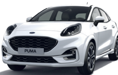
FROZEN WHITE - LAKIER ZWYKŁY 1 200,- | bez dopłaty dla wersji ST X