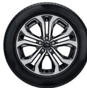
17" OBRĘCZE KÓŁ ZE STOPÓW LEKKICH OGUMIENIE 215/55