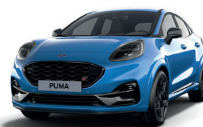
AZURE BLUE - LAKIER SPECJALNY 5 000,- tylko dla wersji ST X