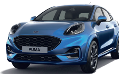
DESERT ISLAND BLUE - LAKIER METALIZOWANY 3 150,- | 1 950,- dla wersji ST X